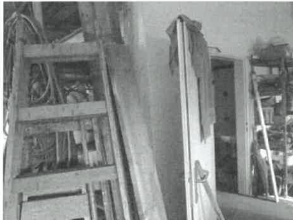
obrázek č. 4 – požární dveře do kotelny zablokované proti dovření

V době kontroly bez zjevných nedostatků.