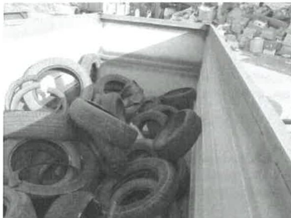
obrázek č. 3 – skladování pneumatik v otevřeném kontejneru