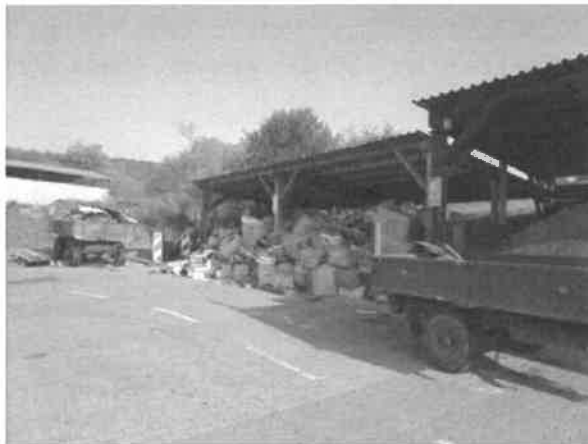
obrázek č. 2 – volná skládka papíru pod přístřeškem

2. Kontrola správnosti začlenění do příslušné kategorie činností dle ust. § 4 zákona o požární ochraně. Kontrola zpracování a vedení dokumentace o začlenění do kategorie činností ve smyslu ust. § 15 odst. 1 zákona o požární ochraně ve spojení s ust. § 28 a ust. § 40 vyhlášky o požární prevenci.