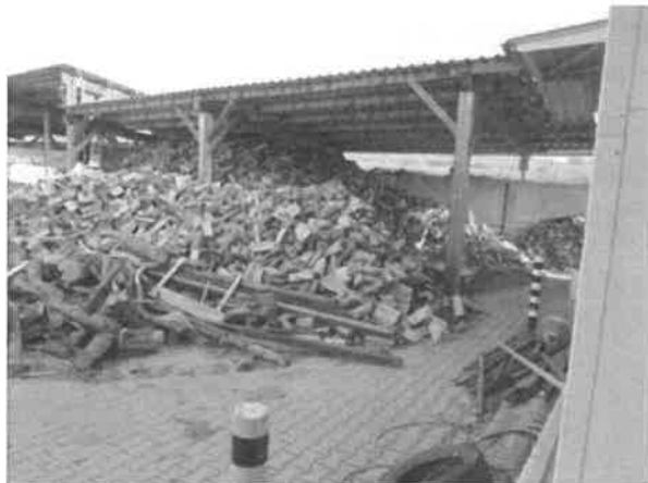
obrázek č. 1 – volná skládka dřeva pod přístřeškem

Pro tyto objekty (přístřešky) a volné skládky nebyla předložena žádná dokumentace (např. kolaudační souhlas, kolaudační rozhodnutí apod.) prokazující povolení těchto objektů a volných skládek v prostoru odpadového centra. Dle sdělení Ing. Tkáčové, starostky, se tato dokumentace v archivu kontrolované osoby nenachází a legalizace změn v užívání a nových objektů v odpadovém centru nebyla provedena. Tím nebyla dodržena povinnost uvedená v ust. § 5 odst. 1 písm. f) zákona o požární ochraně v návaznosti na další předpisy upravující povinnosti na úseku požární ochrany, např. zákon č. 183/2006 Sb. o územním plánování a stavebním řádu.