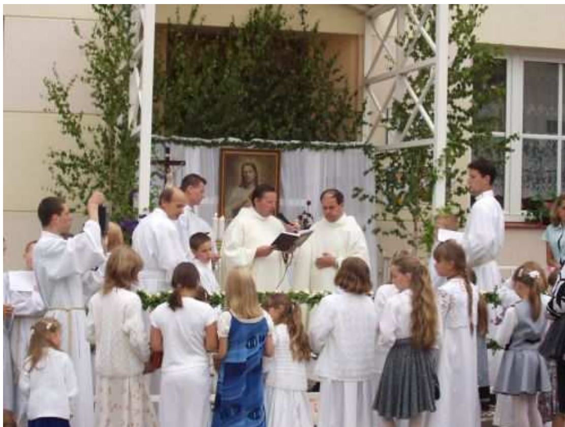
Oltář u základní školy

V neděli 29. 6. 2003 jsme konali tradiční farní pouť na Provodov. Opět v hojném počtu jsme vyrazili pěšky od kostela sv. Martina v Pozlovicích na Řetečov, kde se k nám připojili poutníci z Luhačovic a společně jsme dorazili do kostela Panny Marie Provodovské, kde jsme pouť zakončili slavnostní mší svatou.